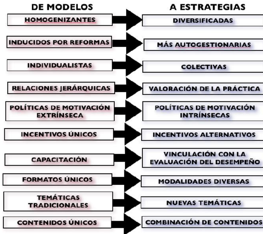
Esquema 1. Síntesis de las tendencias de Lea Vezub

Luego de esta construcción y con fines ilustrativos, se ofrece una síntesis de las diez tendencias que Lea Vezub (Op. Cit.: 40) propone del desarrollo profesional: