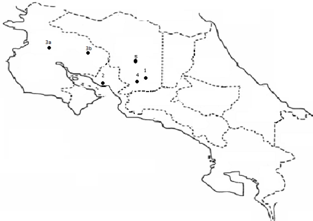
Gráfico N°3 UBICACIÓN Y TELÉFONOS DE LAS SEDES DE LA UNIVERSIDAD TÉCNICA NACIONAL