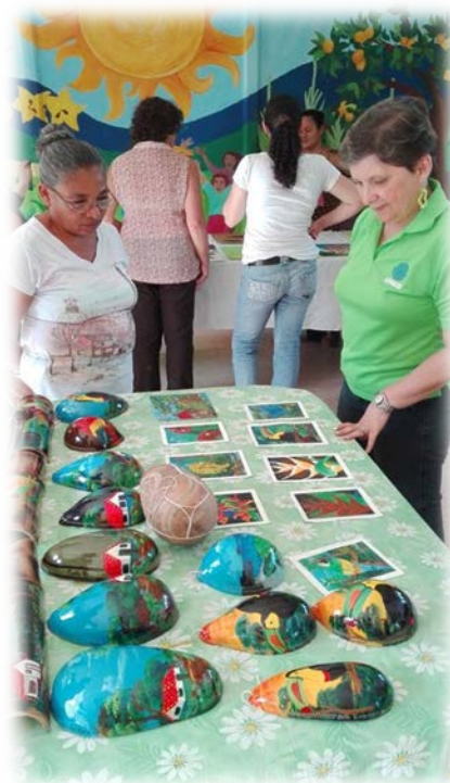
Figura 2. Mural y exposición de pintura

Así mismo, con ARCA se elaboró un mural, el cual representa la herencia de la Tierra, en dicho proceso participaron familias completas, las cuales han llevado con la UNED cursos de pintura durante aproximadamente dos años. Para la inauguración del mural se realizó también una exposición de pinturas.