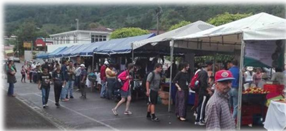
Figura 3. I Feria de Turismo Rural Comunitario Los Santos

Se capacitó a la Asociación Damas Organizadas de San Jorge, Paso Canoas en técnicas para el trabajo con cartón, las cuales permitieron mejorar las destrezas y desarrollar creatividad (18 beneficiarios directos), actualmente, están iniciando con la elaboración de un producto.