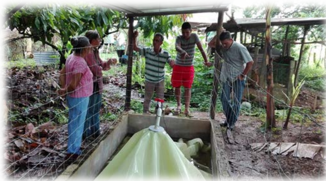
Figura 1. Biodigestores construidos en las fincas

Se continuó con el apoyo a la Asociación Agro ecoturística de la Región Caribe (ARCA), la cual en el 2015 gracias a la implementación de un perfil de proyecto logró la aprobación del fondo Canje de Deuda por Naturaleza (20.000.000 de colones). Por lo tanto, durante el 2016, la UNED brindó acompañamiento en la ejecución del fondo, permitiendo la construcción de invernaderos y biodigestores en cada una de las fincas. Además, se apoyó a la organización en la elaboración de informes técnicos y financieros para INBio.