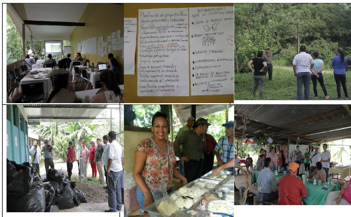
1.3 Curso Diseño de proyectos basado en el marco lógico UTN –Alajuela y TEC-Cartago

Facilitadoras/es: Comisión de capacitación, ejecutores de proyectos.