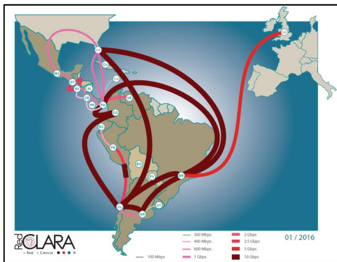
Figura 2. Topología de RedCLARA a enero 2016 (imagen reproducida por permiso de RedCLARA): http://www.redclara.net/index.php/red-y-conectividad/topologia

Actualmente, RedCLARA está conformada por las siguientes redes: INNOVARED (Argentina), RNP (Brasil), RENATA (Colombia), RedCONARE (Costa Rica), REUNA (Chile), CEDIA (Ecuador), RAICES (El Salvador), RAGIE (Guatemala), CUDI (México), ARANDÚ (Paraguay), RAU (Uruguay) y REACCIUN (Venezuela). Cabe destacar que el pasado 21 de octubre de 2016, el Consejo Nacional de Universidades de Nicaragua acordó la creación de la Red Universitaria Nicaragüense de Banda Ancha y su incorporación a RedCLARA.