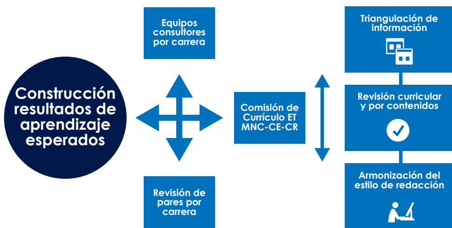
Ilustración 2: Construcción de resultados de aprendizaje con revisión de pares

La consulta de pares revisores se asumió como un proceso consultivo que buscó revisar la precisión, la congruencia y la pertinencia de los resultados de aprendizaje esperados, así como la inclusión del enfoque de derechos humanos para cualificaciones de nivel de grado: bachillerato universitario y licenciatura, con una mirada prospectiva e integral de la realidad.