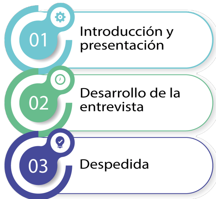
Figura 2 Etapas de la entrevista